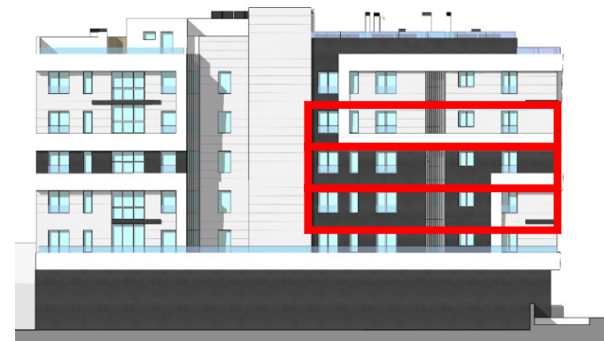
UBICACIÓN EN LA FACHADA